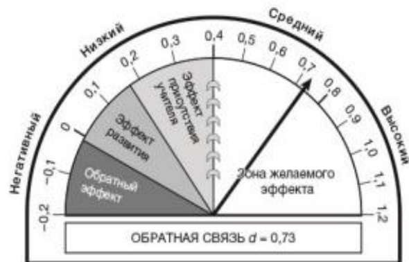
Рис. 7. Эффективность обратной связи в учебном процессе