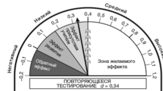
Рис. 8. Эффективность повторяющегося тестирования