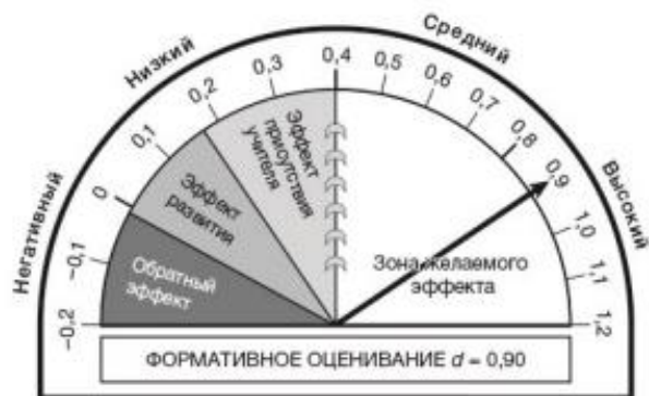
Рис. 6. Эффективность формирующего (формативного) оценивания в учебном процессе